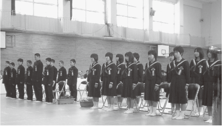
緊張した面持ちで新入生氏名点呼