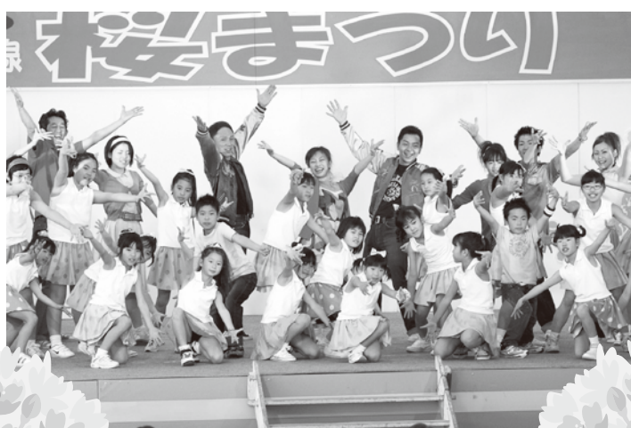
SAKURA組の見事なダンス