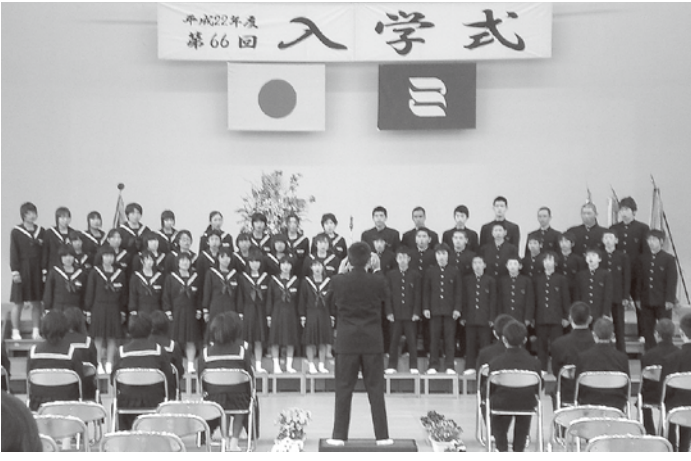
在校生による歓迎の歌「タンホイザー」