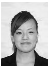
①特別支援教育支援員