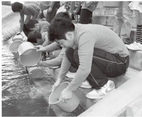
岩野小学校卒業生達による稚鮎の放流

放流も行われ、若アユも元気に清流球磨川を遡上して行きました。 工事期間中は、皆様方に大変ご面倒をお掛け致しました。今後、幹線道路として多くの方々にご利用されることでしよう。