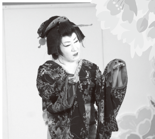
玄海竜二一座公演