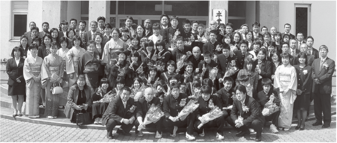
卒業式後に、保護者と一緒に記念撮影