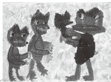
入選した感想画 「だいすきなおかあさん、ぐう」