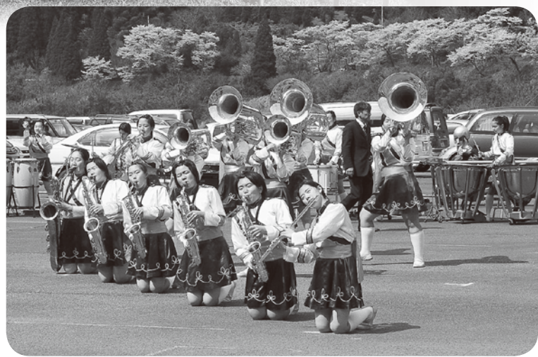
玉名女子高校吹奏学部マーチング