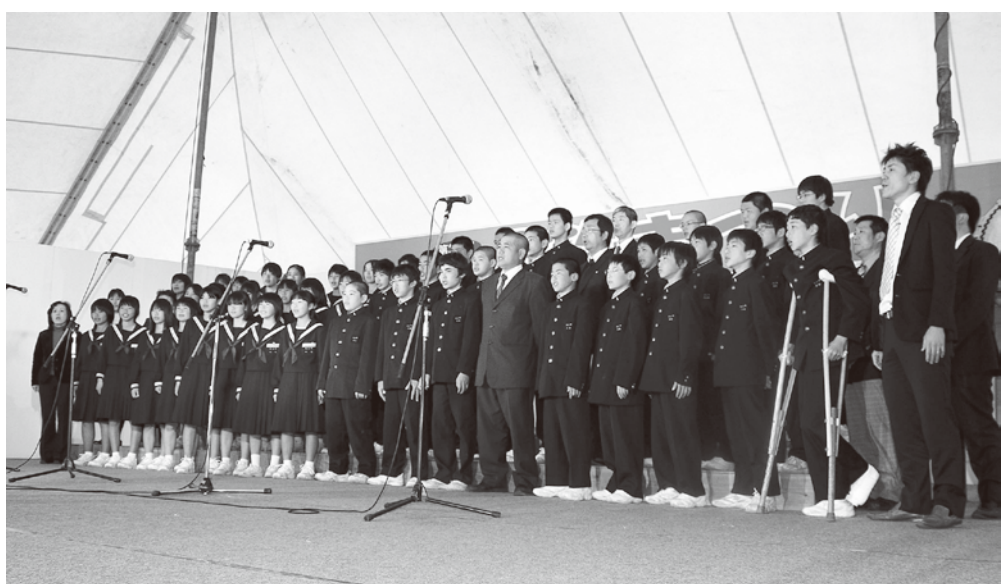
中学生の見事な合唱