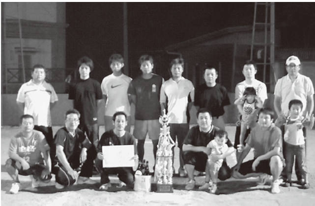
優勝した宮田分館チーム