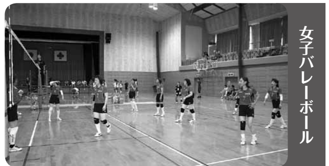
女子バレーボール