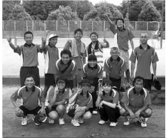
優勝したソフトテニス