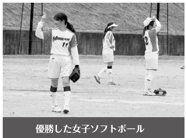
優勝した女子ソフトボール