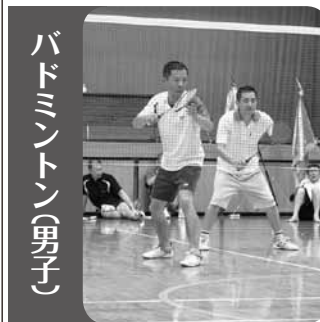
バドミントン(男子)