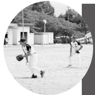
男子ソフトボール