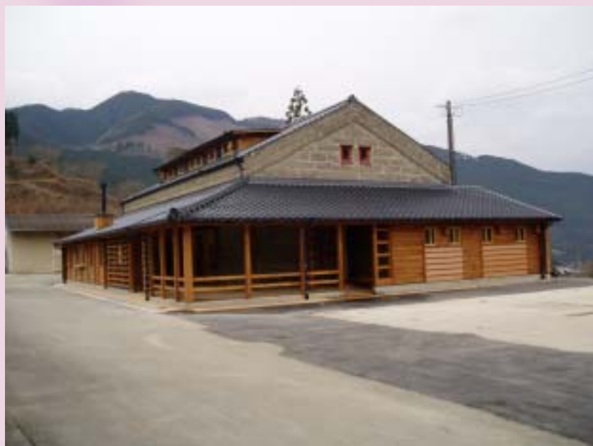
JA入り口から見る石倉