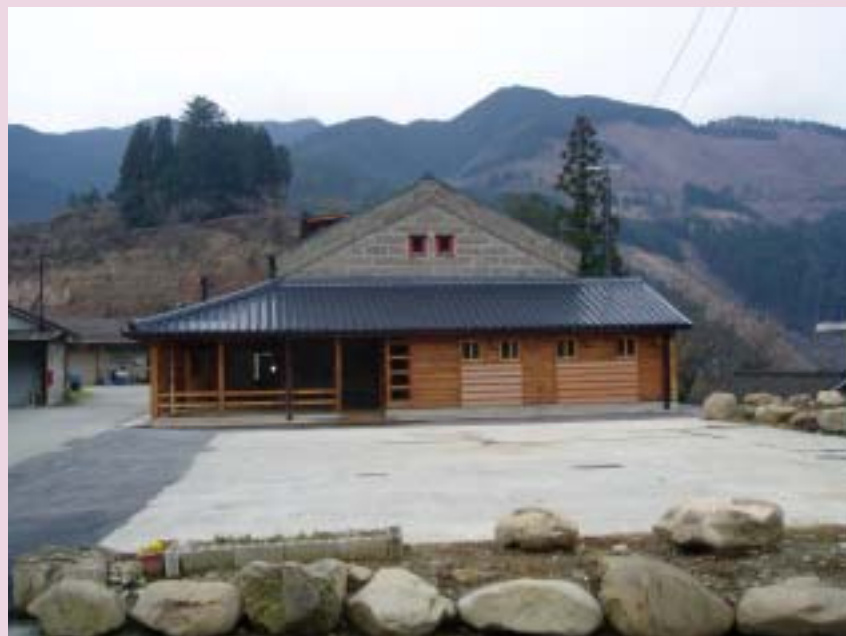
村道から北面の石倉を見る(奥に見えるのは高城山)