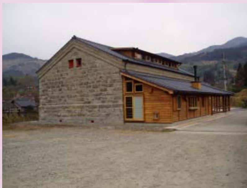
南面の石倉を見る