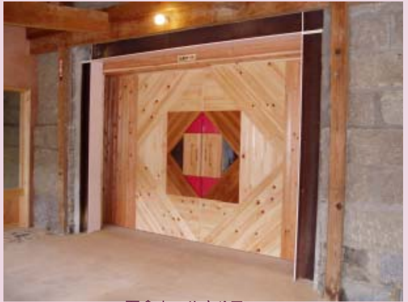
石倉ホール入り口