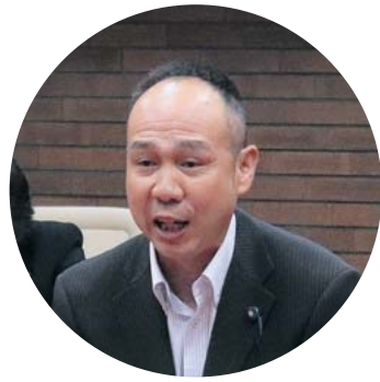
杉野 久志 議員