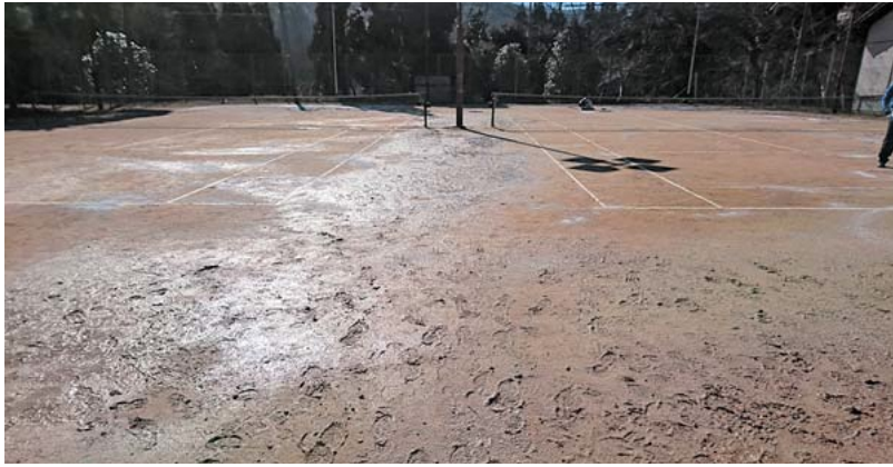
雨でぬかるんだ中学校テニスコート