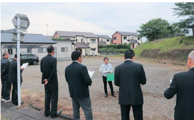
単身向け定住促進住宅建設予定地(岩野)