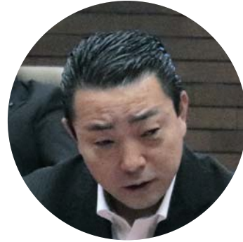
山崎 隆浩 議員