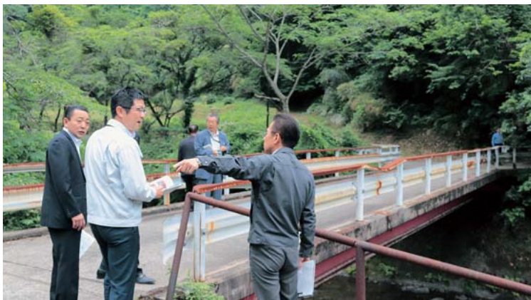
老朽化した坂下橋(川内地区)