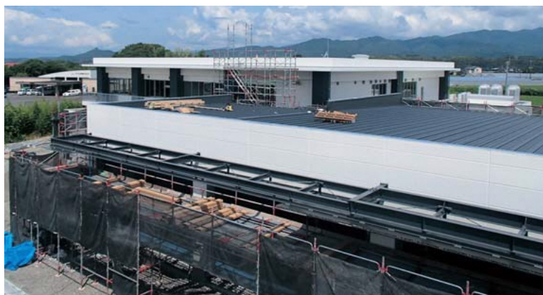
現在建設中の上球磨消防署新庁舎

本庁舎は、平成31年4月26日を工期としていたが、原材料の入荷の遅れ、技術者の人材不足等を理由に8月30日まで工期延長となった。8月30日で内装工事を完了し、外装工事を待たずにシステム工事を行い、11月から運用開始予定。その後、旧庁舎の解体、訓練棟の建設、外構工事を含め、令和2年度内に全ての工事が完了する見込み。