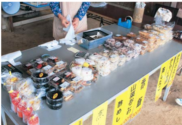
地元食材を利用した商品

物と加工品関係を、2期目の実設計画期間で販売に力を入れ、3年以内に何らかの成果を出したい。