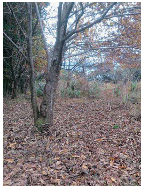
耕作放棄地の目立つ栗園

基本的に農地の管理者は所有者である。しかし、今後農地として維持するのが難しい場所については、農業委員会から非農地化の許可を得て、山林へ転用し、所有者の負担をなくすことも耕作放棄地対策の一つだと考える。