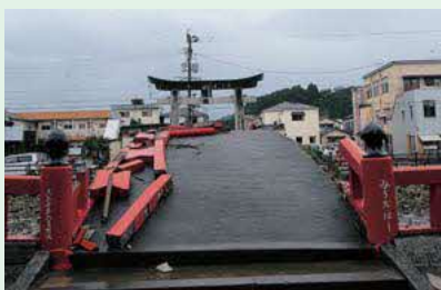
青井阿蘇神社 みそぎばし

「今回の災害でお亡くなりになられた方々のご冥福をお祈りすると共に、被災された皆様にお見舞い申し上げます」