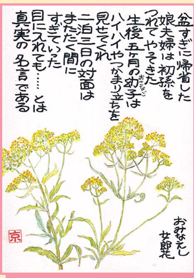
おみなえし 女郎花(女郎花科)