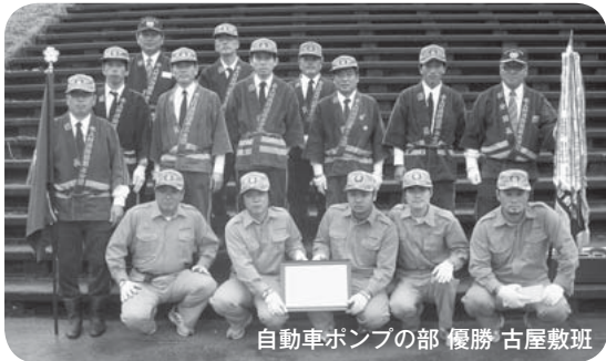
自動車ポンプの部 優勝 古屋敷班