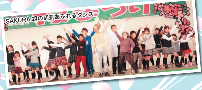
SAKURA組の活気あふれるダンス