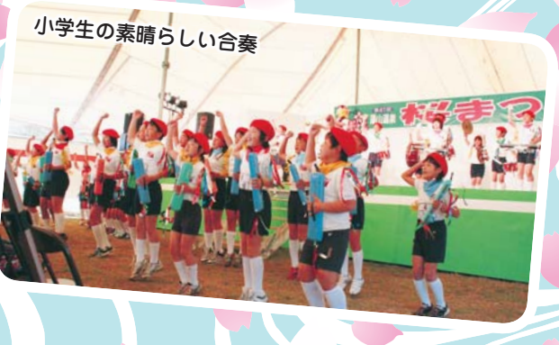
小学生の素晴らしい合奏