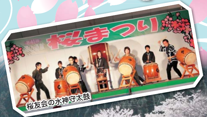
桜友会の水神守太鼓