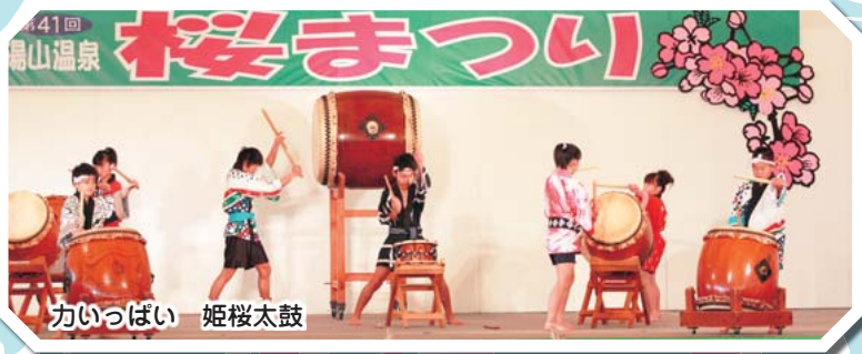
カイツバウ 姫桜太鼓