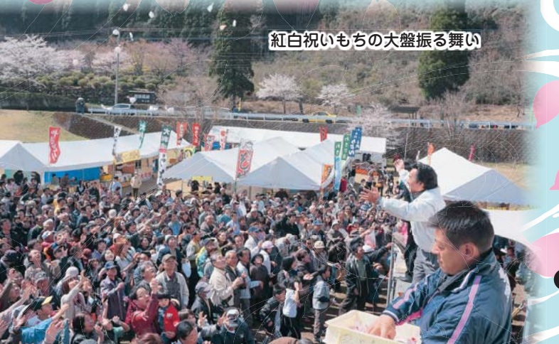
紅白祝いもちの大盤振る舞い