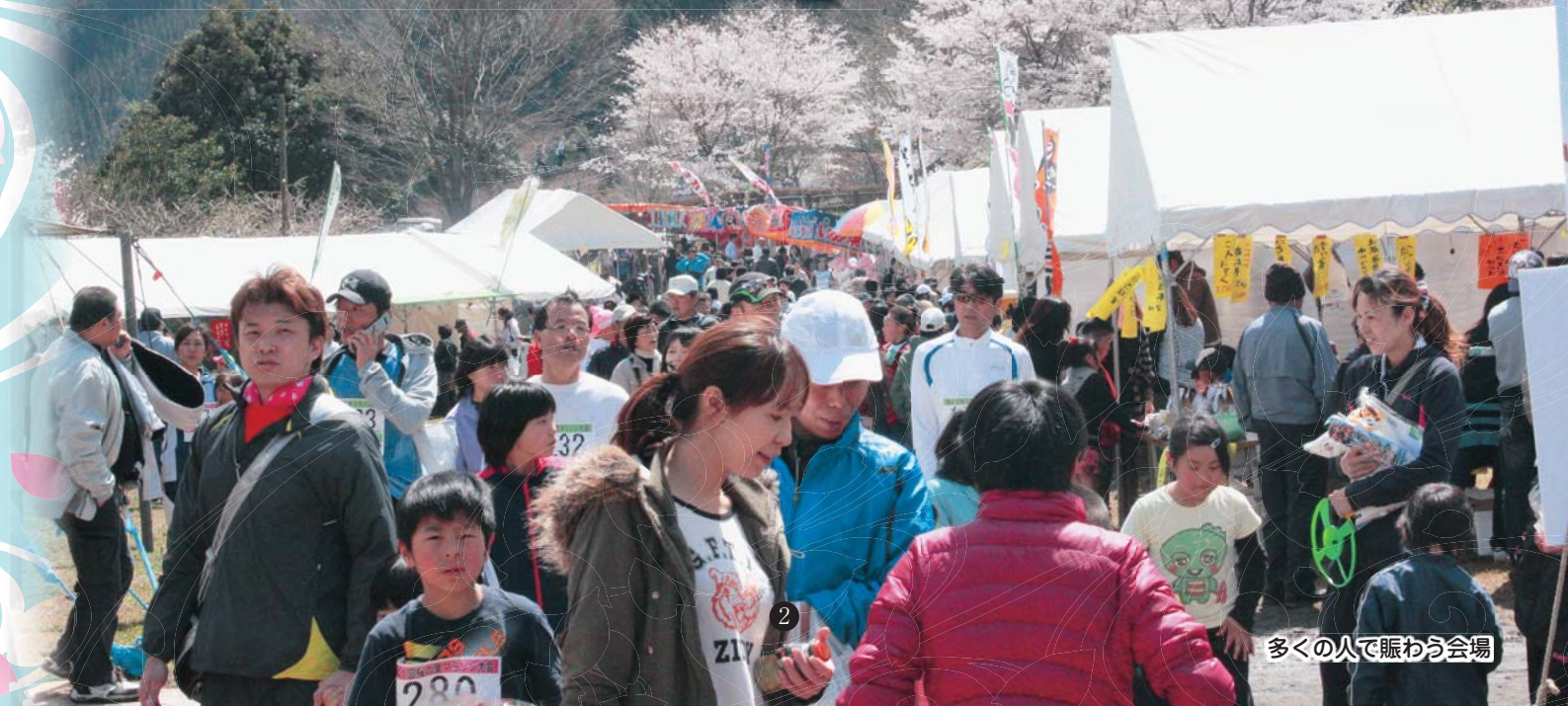
多くの人で賑わう会場