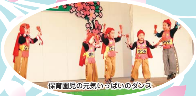
保育園児の元気いっぱいダンス