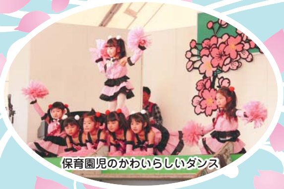
保育園児のかわいらしいダンス