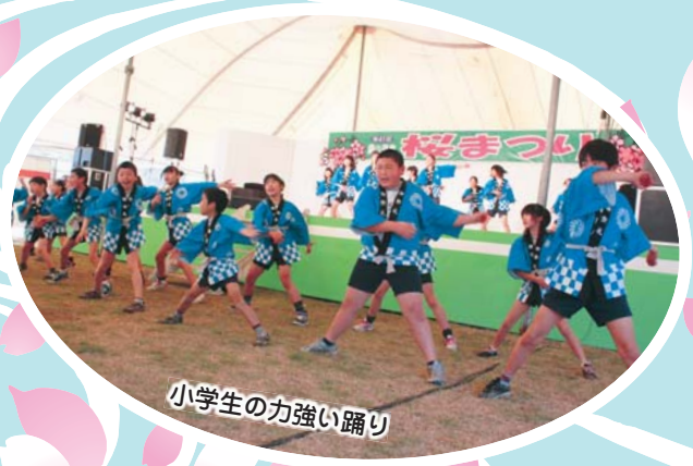
小学生の力強い踊り