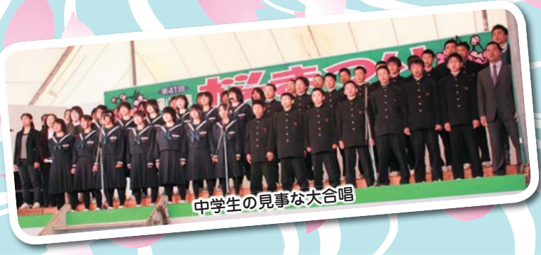
中学生の見事な大合唱