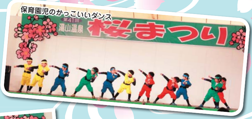
保育園児のかっこいいダンス