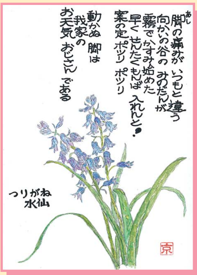
つりがね水仙(ゆり科)

原産地はヨーロッパ(針葉樹林に原生)、アジア、アフリカです。開花時期は三～六月頃。花の色は、青・白・桃・紫があります。