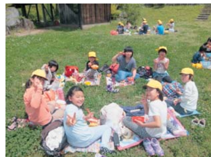
楽しいお弁当タイム

遠足前に体育館で「1年生を迎える会」が行われました。お兄さんやお姉さん達の楽しい発表に1年生の子供達は大喜びでした。その後、縦割り班毎に「湯山探険ウォークラリー」へ出発。これからお世話になる地域の方々にご挨拶をしながら元湯の森を目指しました。歩き疲れた後のお弁当は格別だったようです。