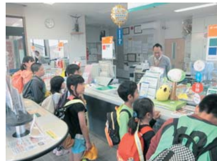
湯山探険ウォークラリー

遠足前に体育館で「1年生を迎える会」が行われました。お兄さんやお姉さん達の楽しい発表に1年生の子供達は大喜びでした。その後、縦割り班毎に「湯山探険ウォークラリー」へ出発。これからお世話になる地域の方々にご挨拶をしながら元湯の森を目指しました。歩き疲れた後のお弁当は格別だったようです。