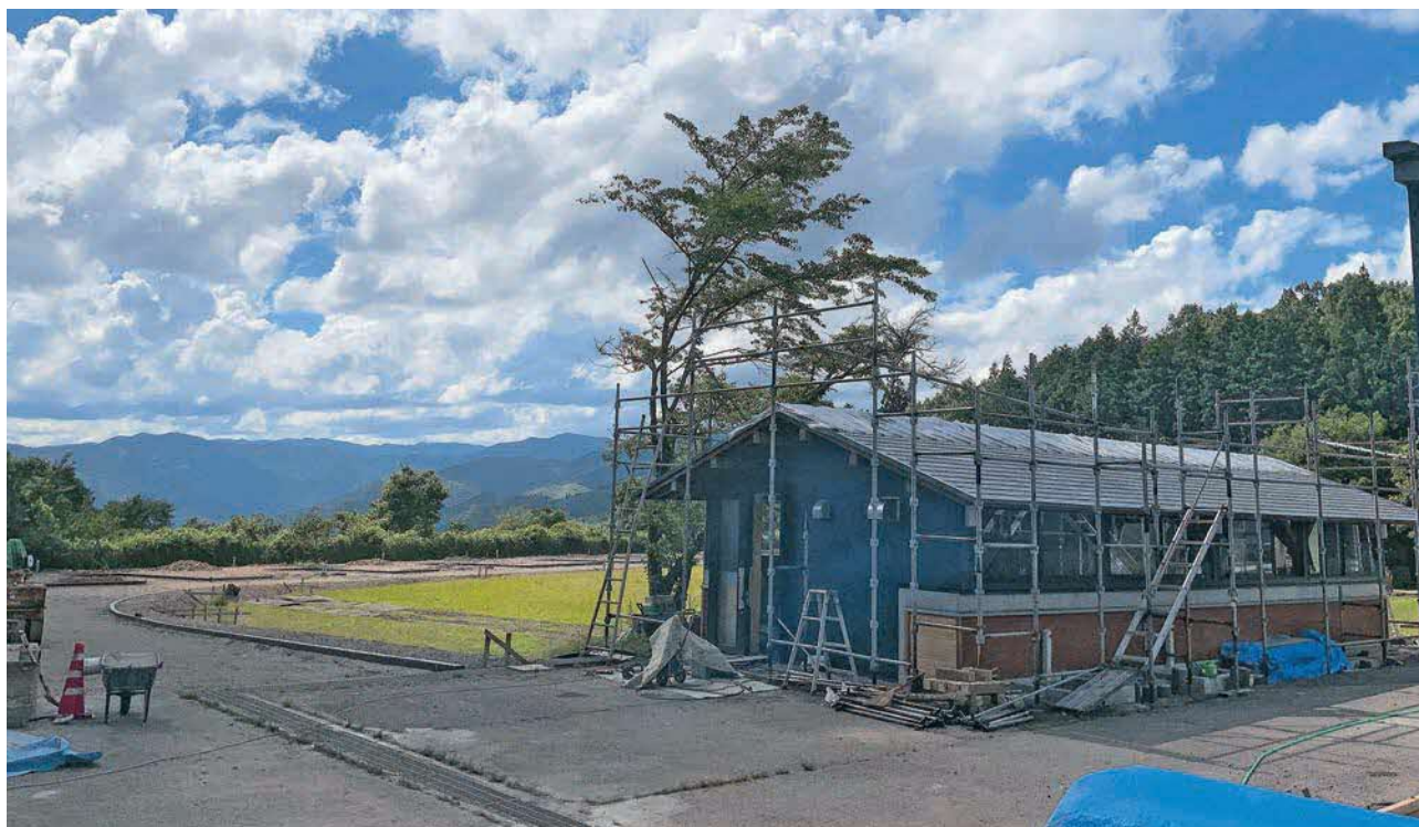
炊飯棟を改修中（外壁で覆い冬場でも快適に利用できる）