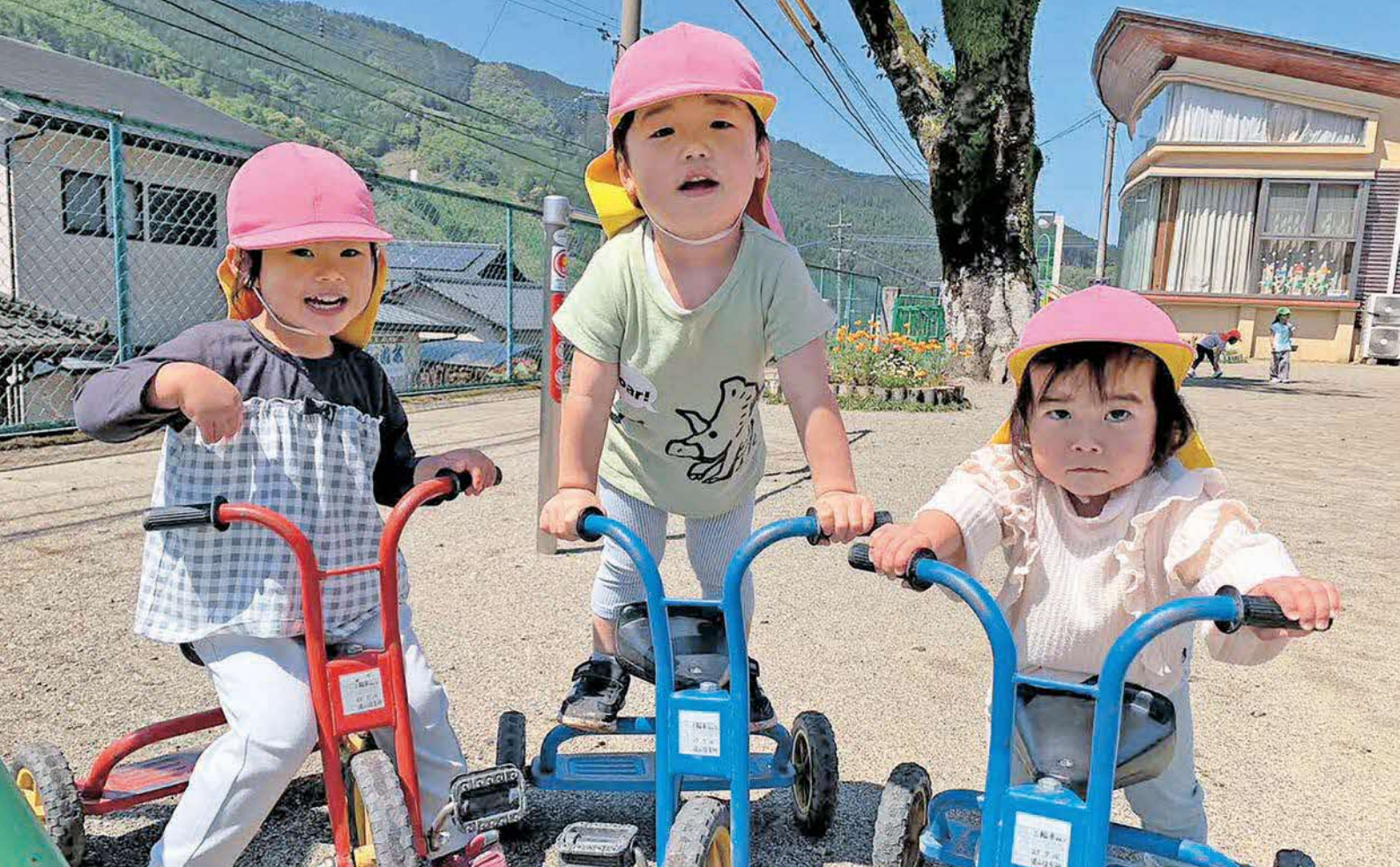
湯山保育所の子どもたち