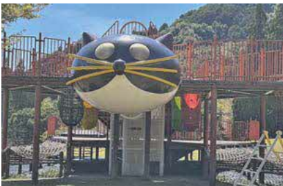
補修予定のほいほい広場のムササビ君

年内完了を目標とし、補修期間が決定次第、現地での周知、回覧、HP等でお知らせする。また補修期間中は周辺の立ち入りを制限する。