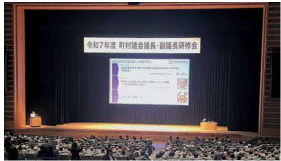
国際フォーラムでの研修の様子

講演では、広域災害時による自治体間の情報共有に役立つ新総合防災システムや物資支援の広域連携、災害発生時の議会の役割、災害発生後の復旧・復興のまちづくりなどについての講演があった。