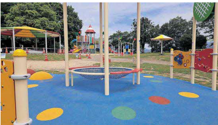
リニューアルした岡留公園のインクルーシブ遊具

※2 PFI：公共施設等の建設、維持管理、運営などを、民間の資金や経営能力、技術的能力を活用して行う手法